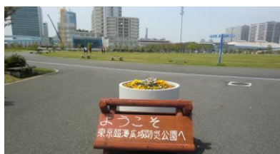
東京臨海臨界広域防災公園

の有明駅があった。正しくは直進すべきところ、誤って左側の鉄道に沿って歩く。10時48分、有明中央橋を渡る。10時56分、有明テニスの森駅通過。