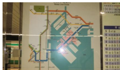
東京テレポート駅

東京テレポート駅には12時27分到着。国道からは分かりにくいところにあつた。この駅で再度駅員さんに「天王洲アイランドまで歩ける道があるか否か」を確認する。「この区域は島のため、ありません。歩くとすればレインボブリッジ（ゆりかもめ）でしょう」と。ゆりかもめは数年前に歩いたため、東京テレポート～天王洲アイランド間は電車で移動することにする。12時37分の快速で天王洲アイランドへ。