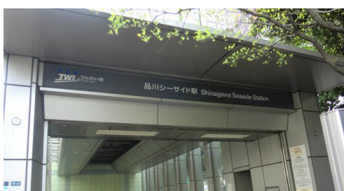
品川シーサイド駅

京モノレールとは逆の動きとなった。12時52分、東品川橋を通過。13時7分、品川シーサイド駅に到着。この駅の目と鼻の先にイオンがあった。駐車場誘導の方に、大井町駅方面を問い合わせる。懇切丁寧に大井町駅の道筋を教えて頂く。基本的には一本路であった。途中、京急青物横丁駅（13時21分）があった。大井町駅には13時37分到着。そして、大崎駅には14時6分到着。横須賀線踏破の際に比べ、駅前には整備されていた。本日は営業キロは9.3km（万歩計37,626歩）であったが、ウォーキングの醍醐味を堪能させてもらう1日となった。通算営業キロは7,756.8kmに。自宅には16時5分到着。