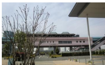
ゆりかもめ有明駅